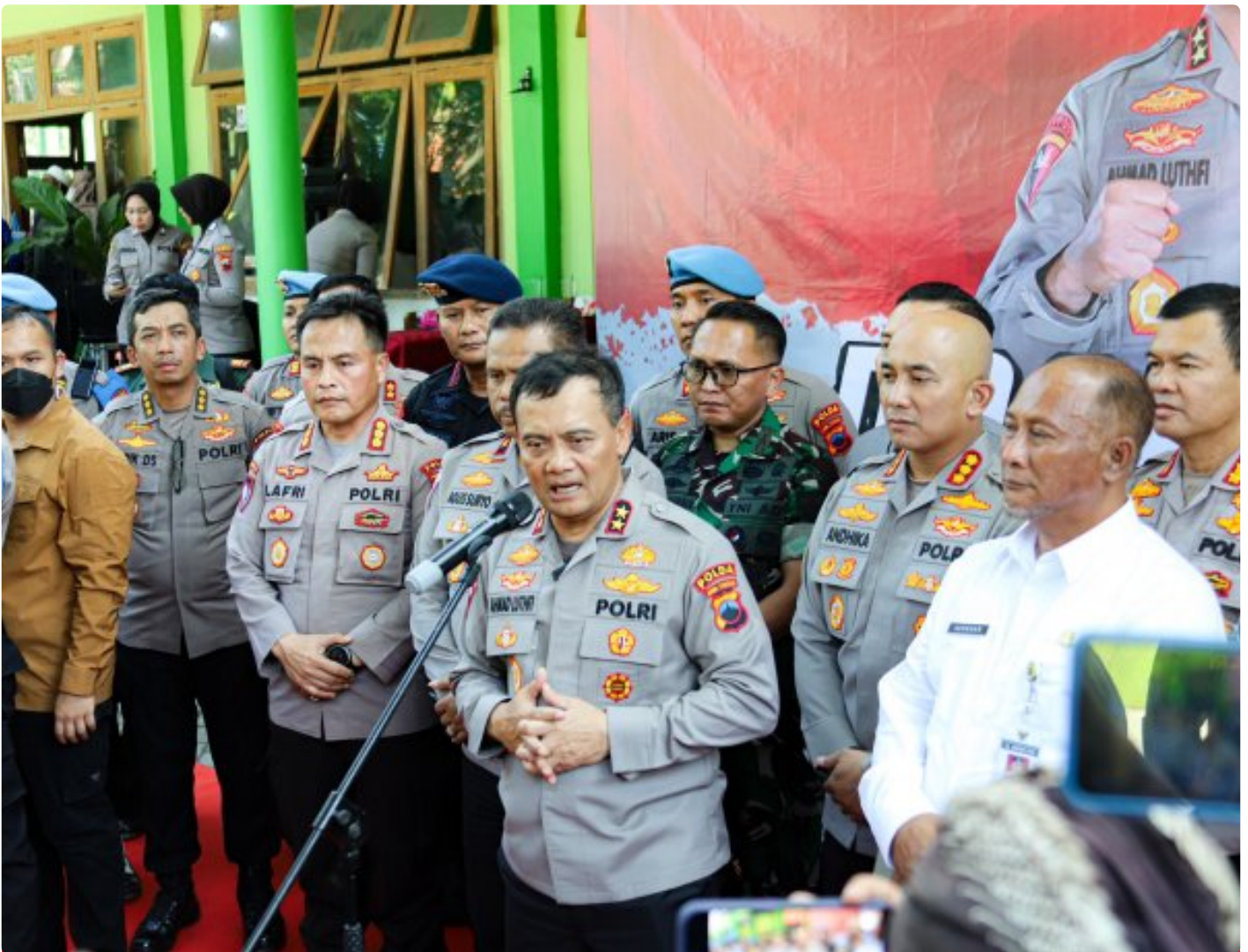
Foto: Kapolda Jateng Irjen Pol Ahmad Luthfi Menghimbau Warganet Untuk Menghentikan Pemberian Label Negatif di Wilayah Kabupaten Pati, Sabtu ( 22/6/2024).

KOTA SEMARANG- Penandaan negatif terhadap wilayah Sukolilo di Peta Digital kini telah berangsur hilang. Perubahan itu terjadi pasca kunjungan Kapolda Jawa